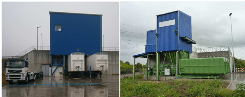
WF átrakóállomás (Szentlőrinc) Préses átrakóállomás (Pécs I.)

A szolgáltatási területen lévő nagy távolságok miatt 6 db átrakó állomás üzemel. Közülük 3 db préses, 3 db pedig korszerű „walking floor” rendszerű átrakó. A „walking floor” átrakókon egyszerre 2 db gyűjtőjármű üríthető.